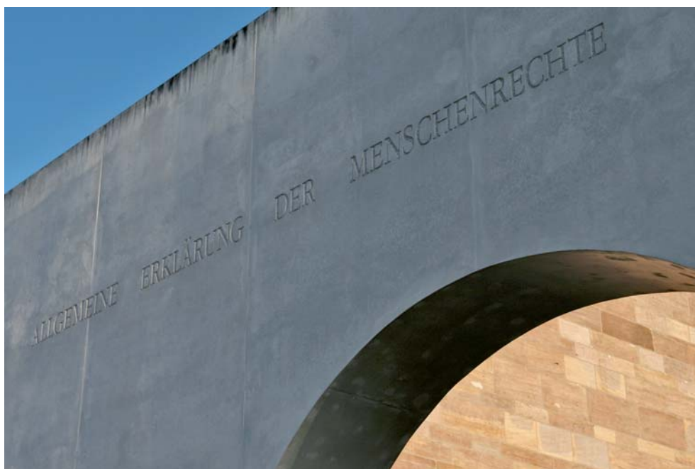
Straße der Menschenrechte in Nürnberg

Ziel von Integration ist es, den Einwohner(inne)n Deutschlands eine umfassende selbst bestimmte wirtschaftliche, soziale, kulturelle, rechtliche und politische Teilhabe zu ermöglichen. Wichtige Merkmale gelungener Integration sind gegenseitige Anerkennung sowie Partizipation, Gleichberechtigung und Chancengleichheit.